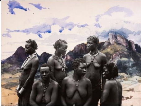
« Portrait 3 : groupe de femmes Arua » de Sammy Baloji

L'œuvre « Portrait 3 : groupe de femmes Arua » de Sammy Baloji est aussi une œuvre importante en ce qu'elle témoigne des interrogations de l'artiste en matière de mémoire collective et de réappropriation/construction historique, spécifiquement à l'égard du passé colonial de la Belgique. Par une réinterprétation artistique de documents d'archives coloniales, Sammy Baloji invite à porter un regard critique et interrogateur sur ces notions au cœur de nos sociétés actuelles. Ce jeune artiste connaît une reconnaissance internationale exemplaire.